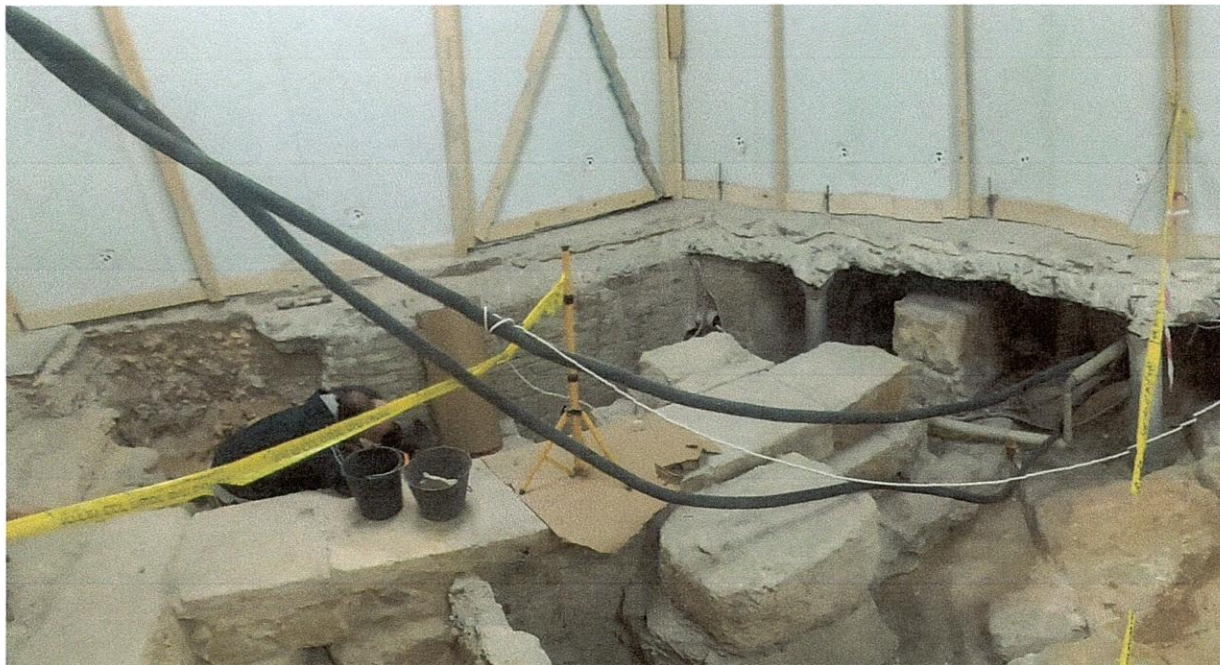
Πανοραμική αποψη της ανασκαφής