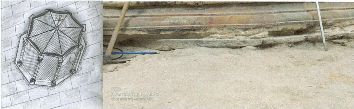
Η Θεμελίωση του Ι.Κουβουκλίου του 18 αι. πάνω στην Κωνσταντινεια φαση